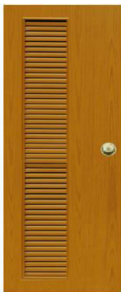
T 7 สีสักเหลือง เกล็ดข้างตลอดบาน