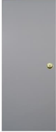
T2 สีเทา บานเรียบ