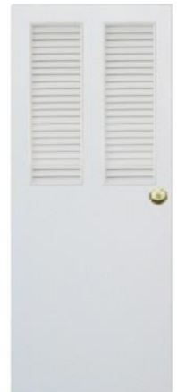
T9 สีขาว เกล็ดคู่ครึ่งบาน