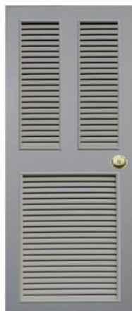
T10 สีเทา เกล็ดคู่+เกล็ดครึ่ง