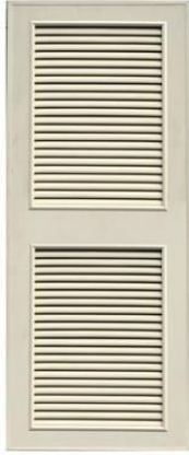
T5 สีครีม เกล็ดครึ่งบาน 2 ตอน

ขนาดมาตรฐาน : 70x180 70x200 80x180 80x200 สั่งตัดตามขนาดได้