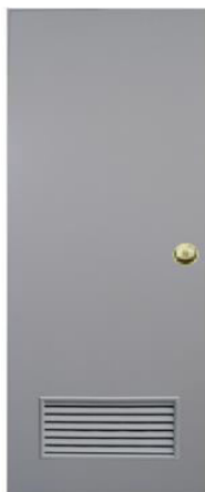
T3 สีเทา ช่องลม 1/4