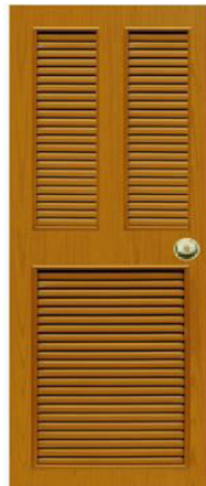
T10 สีสักเหลือง เกล็ดคู่+เกล็ดครึ่ง