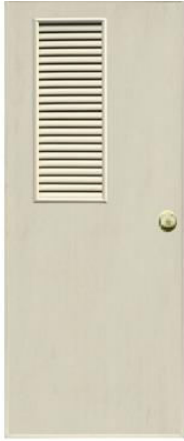
T8 สีครีม เกล็ดข้างครึ่งบาน

ขนาดมาตรฐาน : 70x180 70x200 80x180 80x200 สั่งตัดตามขนาดได้