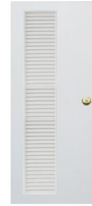
T 7 สีขาว เกล็ดข้างตลอดบาน