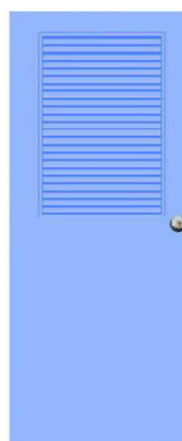
T4 สีฟ้า เกล็ดครึ่งบาน