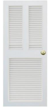
T10 สีขาว เกล็ดคู่+เกล็ดครึ่ง