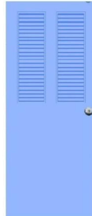
T9 สีฟ้า เกล็ดคู่ครึ่งบาน