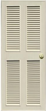
T11 สีครีม เกล็ดคู่บน-ล่าง

ขนาดมาตรฐาน : 70x180 70x200 80x180 80x200 สั่งตัดตามขนาดได้