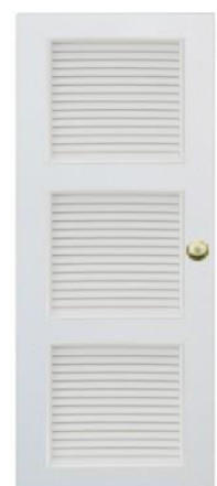
T13 สีขาว เกล็ด 3 ตอน