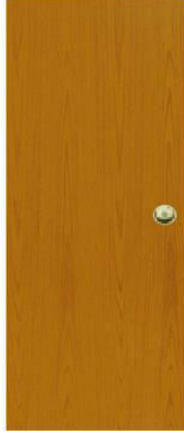
T2 สีสักเหลือง บานเรียบ