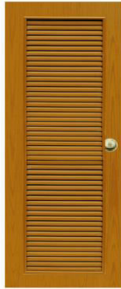
T6 สีสักเหลือง เกล็ดตลอดบาน