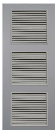
T13 สีเทา เกล็ด 3 ตอน