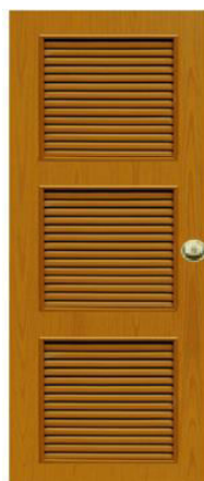
T13 สีสักเหลือง เกล็ด 3 ตอน