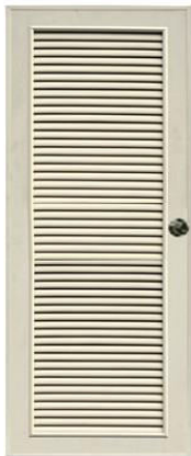
T6 สีครีม เกล็ดตลอดบาน