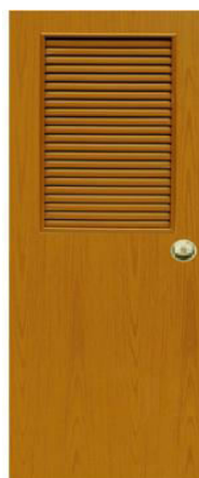
T4 สีสักเหลือง เกล็ดครึ่งบาน