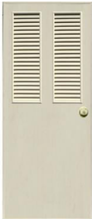
T9 สีครีม เกล็ดคู่ครึ่งบาน