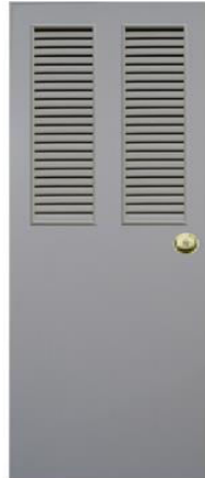
T9 สีเทา เกล็ดคู่ครึ่งบาน