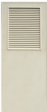
T4 สีครีม เกล็ดครึ่งบาน