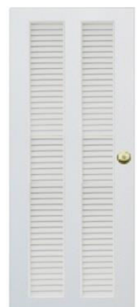
T12 สีขาว เกล็ดคู่ตลอดบาน