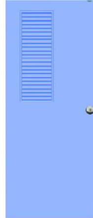
T8 สีฟ้า เกล็ดข้างครึ่งบาน