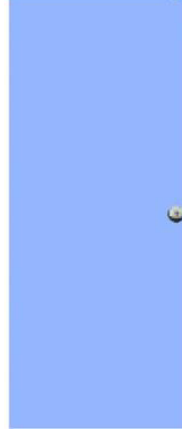
T2 สีฟ้า บานเรียบ