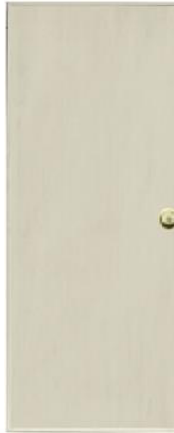
T2 สีครีม บานเรียบ

ขนาดมาตรฐาน : 70x180 70x200 80x180 80x200 สั่งตัดตามขนาดได้