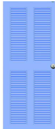
T11 สีฟ้า เกล็ดคู่บน-ล่าง