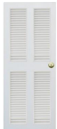
T11 สีขาว เกล็ดคู่บน-ล่าง