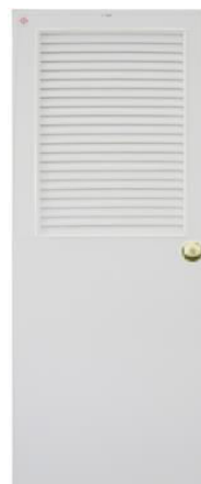
T4 สีขาว เกล็ดครึ่งบาน