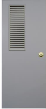
T8 สีเทา เกล็ดข้างครึ่งบาน