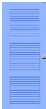
T13 สีฟ้า เกล็ด 3 ตอน