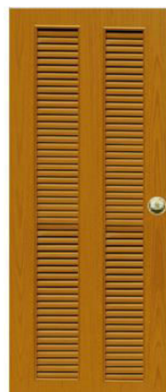
T12 สีสักเหลือง เกล็ดคู่ตลอดบาน