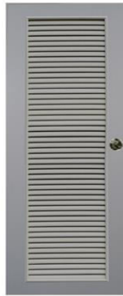
T6 สีเทา เกล็ดตลอดบาน