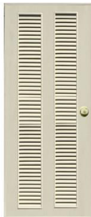
T12 สีครีม เกล็ดคู่ตลอดบาน