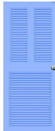
T10 สีฟ้า เกล็ดคู่+เกล็ดครึ่ง