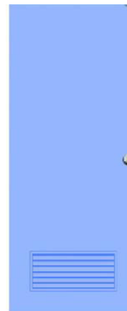
T3 สีฟ้า ช่องลม 1/4