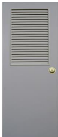
T4 สีเทา เกล็ดครึ่งบาน