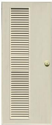
T 7 สีครีม เกล็ดข้างตลอดบาน