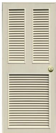
T10 สีครีม เกล็ดคู่+เกล็ดครึ่ง