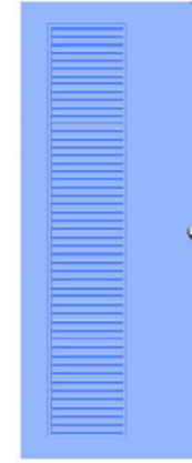
T 7 สีฟ้า เกล็ดข้างตลอดบาน