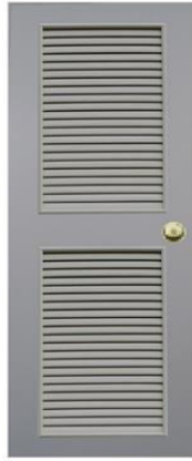
T5 สีเทา เกล็ดครึ่งบาน 2 ตอน