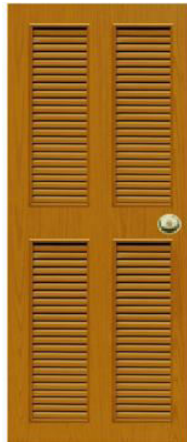
T11 สีสักเหลือง เกล็ดคู่บน-ล่าง