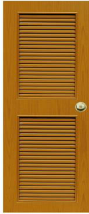
T5 สีสักเหลือง เกล็ดครึ่งบาน 2 ตอน