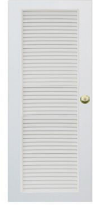
T6 สีขาว เกล็ดตลอดบาน