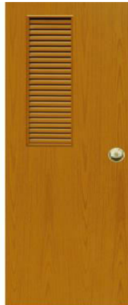
T8 สีสักเหลือง เกล็ดข้างครึ่งบาน