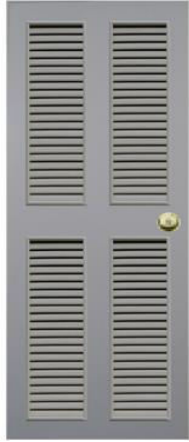
T11 สีเทา เกล็ดคู่บน-ล่าง