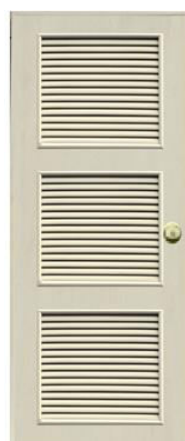
T13 สีครีม เกล็ด 3 ตอน