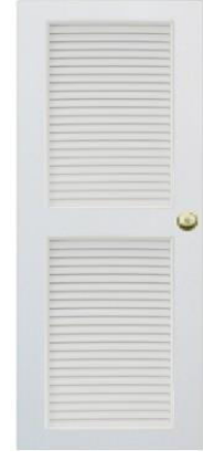
T5 สีขาว เกล็ดครึ่งบาน 2 ตอน