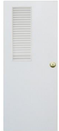
T8 สีขาว เกล็ดข้างครึ่งบาน