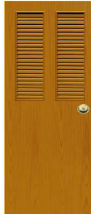
T9 สีสักเหลือง เกล็ดคู่ครึ่งบาน