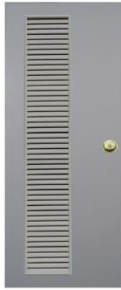
T 7 สีเทา เกล็ดข้างตลอดบาน