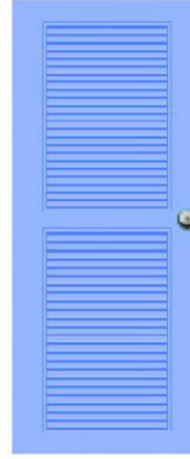
T5 สีฟ้า เกล็ดครึ่งบาน 2 ตอน