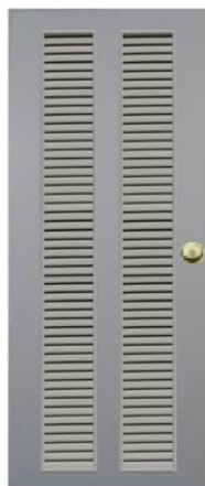
T12 สีเทา เกล็ดคู่ตลอดบาน