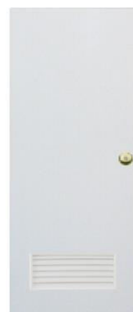
T3 สีขาว ช่องลม 1/4