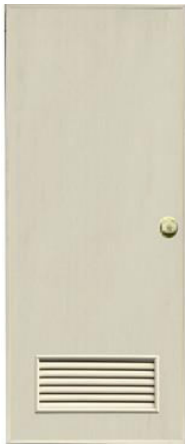
T3 สีครีม ช่องลม 1/4